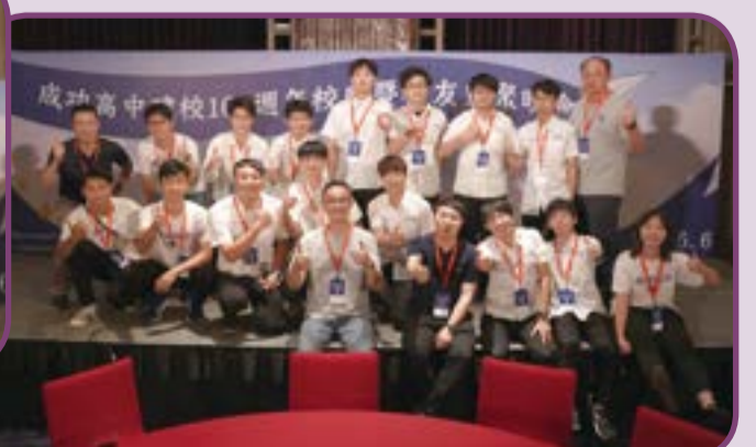
▲ 校友會志工圓滿完成本日晚會活動。