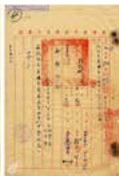
1946.1.4行政長官公署教育處派令