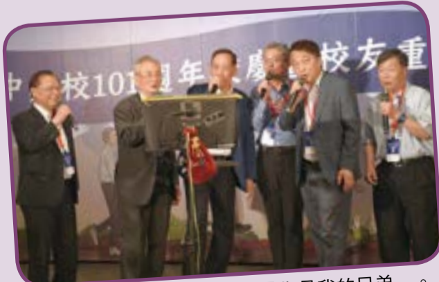
▲ 校友會理監事成員齊唱「你是我的兄弟」。