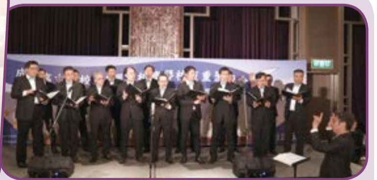
▲ 成功高中校友合唱團帶來美聲演出。