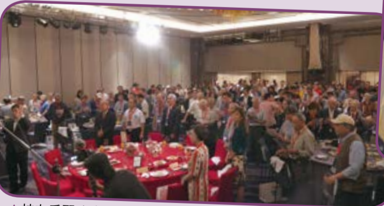
▲ 校友重聚晚會席開22桌，熱鬧非凡。