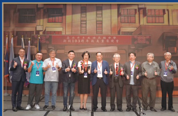
■ 本屆與下屆召集人合照