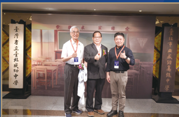
■ 本次晚會拍照牆，供學長們創造回憶