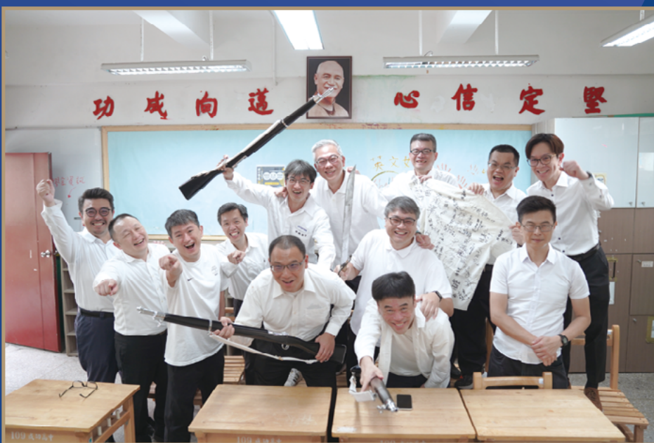
■ 復刻舊教室活動，讓學長們在重聚一起回顧當年光景