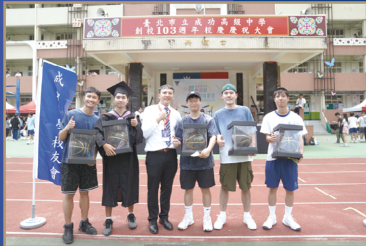
■ 成功校友投籃大賽第二屆頒獎合照