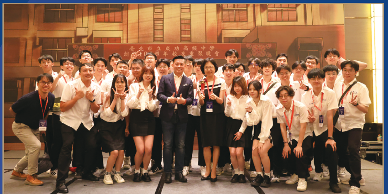
■ 工作人員與理事長和校長大合照