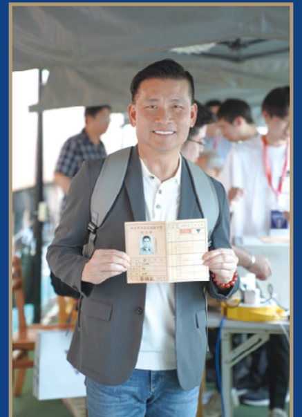
■ 理事長與這次新推出的校友證體驗成品合照